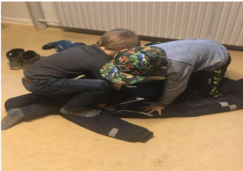
Storemakker hjælp i garderoben

Dagtilbuddet støtter og styrker børnenes sociale, personlige og faglige færdigheder, bl.a. gennem KLAR til Læring og de seks læreplanstemaer .