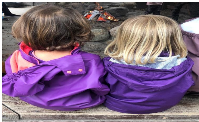
Relation & fællesskab